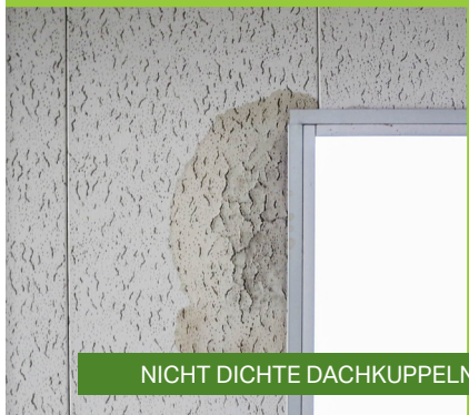
NICHT DICHTE DACHKUPPELN