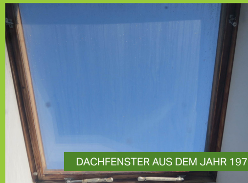
DACHFENSTER AUS DEM JAHR 1975